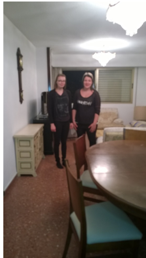
oikealla kuva tyttöjen olohuoneesta